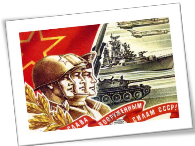
"Слава вооруженным силам СССР!" Художник Ю. Косоруков Открытка выпущена в 1978 году

Мечта любого мальчишки получить такой замечательный тортик «Танк» к празднику! Да что там ребенок, даже взрослый мужчина обрадовался бы такому подарку, так что, давайте побалуем наших любимых мальчиков!