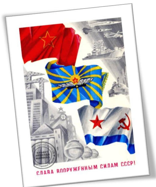
"Слава вооруженным силам СССР!" Художник А. Андрюхин Открытка выпущена в 1988 году